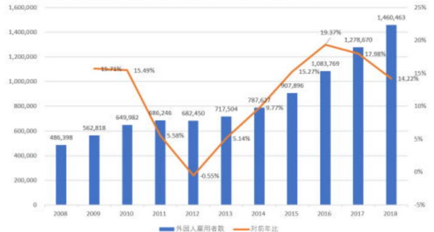
日本の外国人雇用者数（左、人）と対前年比増加率（右、%）